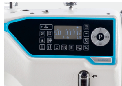
针距精准，稳定可靠