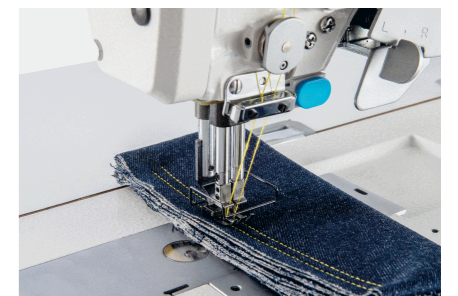
电子夹线，起缝线迹更美